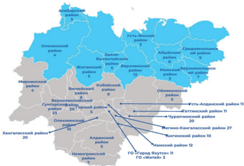
Рис. 2. География реализованных проектов Программы поддержки местных инициатив в 2023 г. [24]

Следует обратить внимание, что участие предпринимателей и юридических лиц в инициативном бюджетировании наименее стабильно. В благоприятные периоды оно возрастает, однако при снижении прибыльности бизнеса под влиянием разнообразных факторов, соответственно, тоже сокращается.